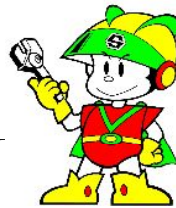
マスコットキャラクター セイロマン